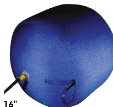
Teplu odolné zátky