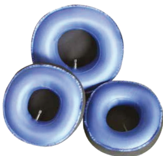
Nafukovacie zátky šiškového tvaru